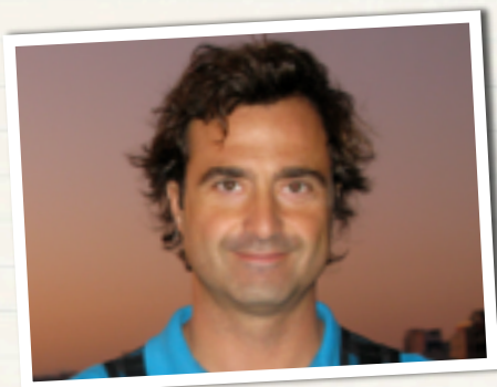
Director de Sost4